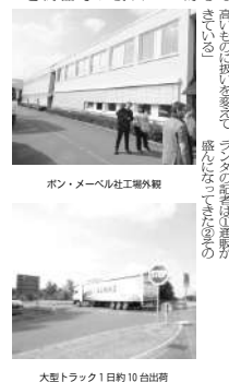
ボン・メルセル工場外観 大型トラック1日約10台出庫

ドイツの生産地、デューセル北東に約17社でグループ形成。各国記者が語る家具消費の傾向。ロシアで売れる独・伊の家具。平均単価振るわずも市場影響度高し。卸売額とも5年で3倍近く成長。